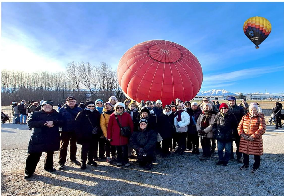
6 gennaio 2026. Befana a Mondovì