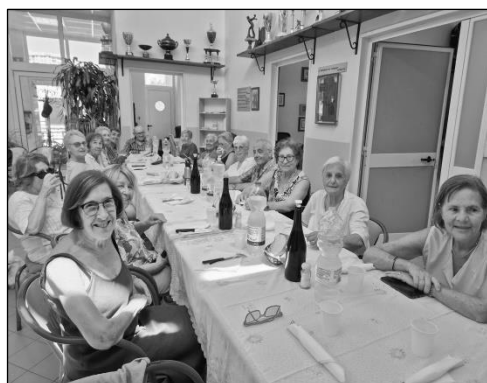
E... finalmente a tavola! Buon pranzo ...

La giornata si è svolta in una proficua gara ed è proseguita con un buon pranzo (finalmente!) e tanta allegria. Pensiamo che l'esperienza verrà replicata anche per il prossimo anno. Bravi gli organizzatori e un applauso ai Soci che hanno partecipato in molti e calorosamente! Sarà stato il meteo?