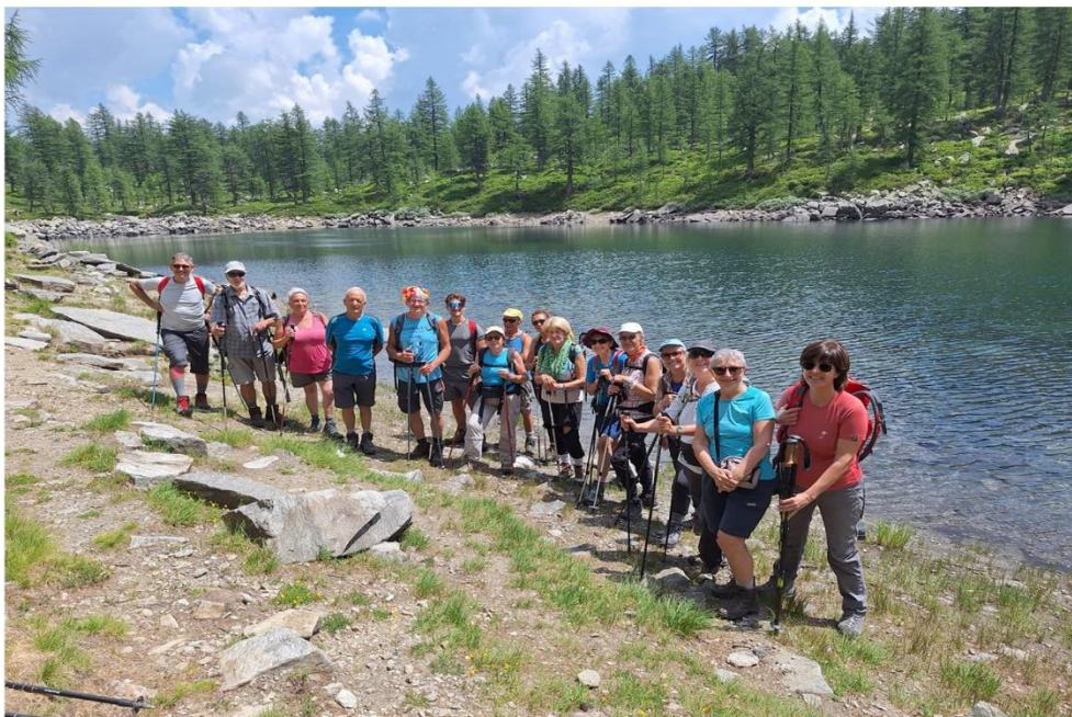
24-26 Giugno. Trek dell'Alpe Devero